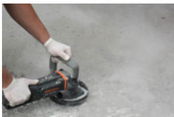
1. Príprava podkladu