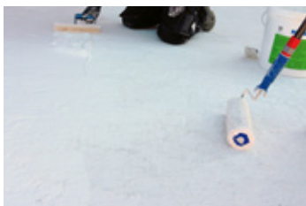
5. Druhá vrstva KÖSTER 21