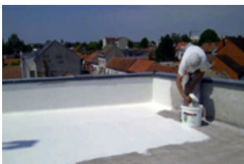
3. Prvá vrstva KÖSTER 21