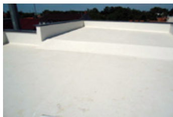
6. Konečný výsledok