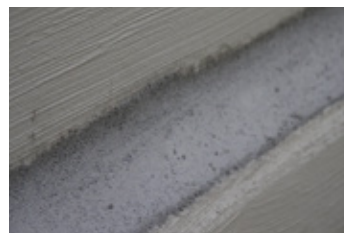
2. Vytvorenie fabiónov s KÖSTER Repair Mortar